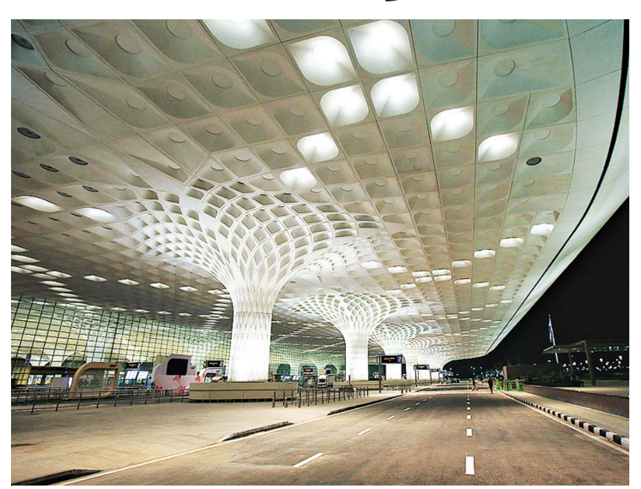
The land parcels in question are close to the international terminal and can fetch a lease rent of around ₹175 a sq ft